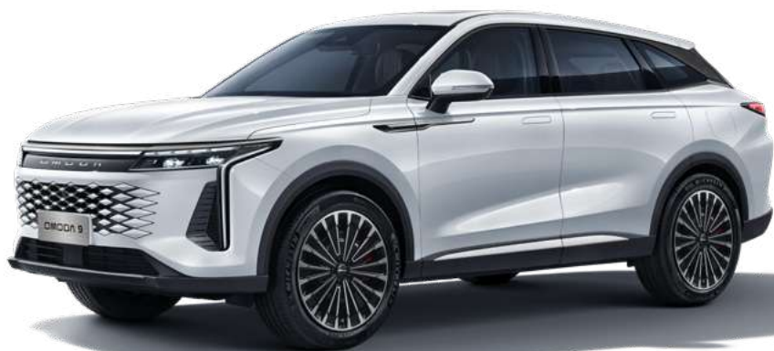
STAR WHITE - lakier metalizowany Bez dopłaty