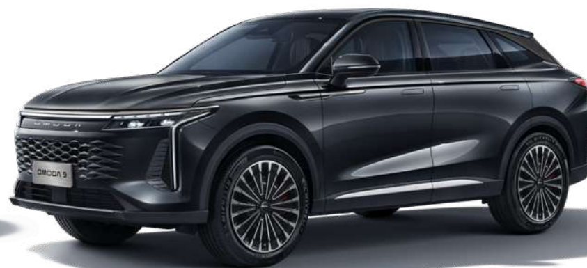
INK BLACK - lakier metalizowany Bez dopłaty