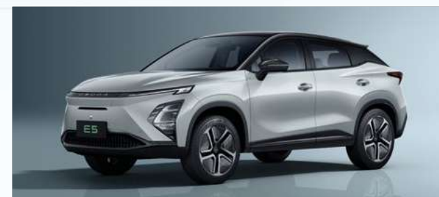
Aviation Silver z czarnym dachem (X4)