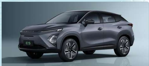
Phantom Gray (GV)