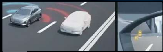
System monitorowania martwego pola