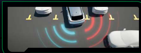
System ostrzegania przed kolizją podczas cofania

Omoda E5 - tak jak wersja z napędem spalinowym wyposażona jest w pełen zestaw zaawansowanych systemów od kontroli pasa ruchu, przez monitor martwego pola, po inteligentny tempomat adaptacyjny.