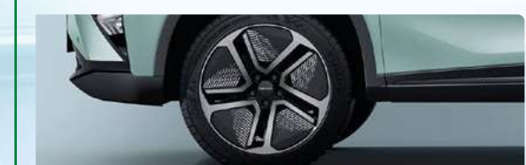
18" obręcze kół ze stopów lekkich