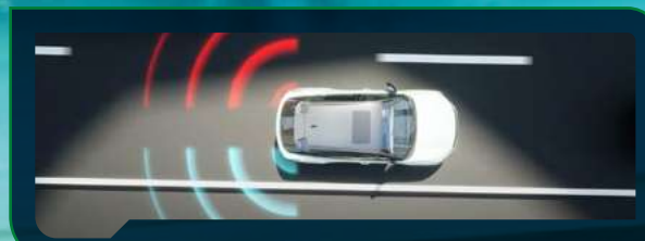
System monitorowania martwego pola