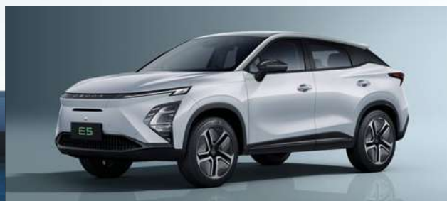
Khaki White (BW)