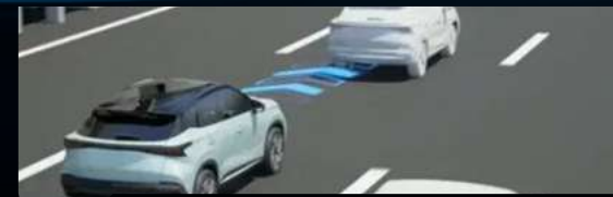
Tempomat adaptacyjny z funkcją utrzymywania na pasie ruchu (ACC)