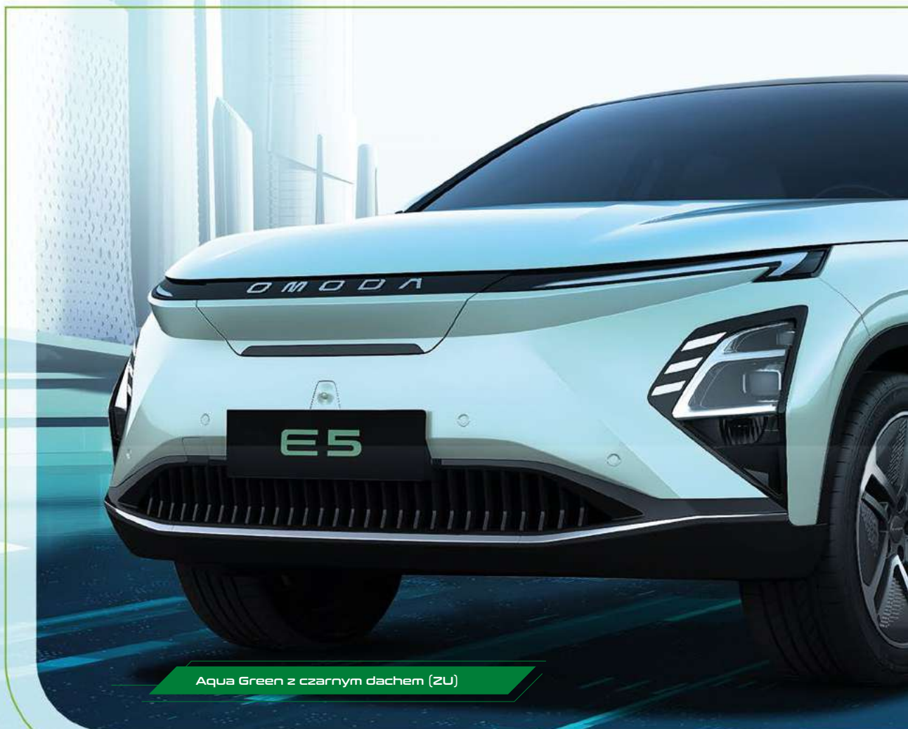
Aqua Green z czarnym dachem (ZU)