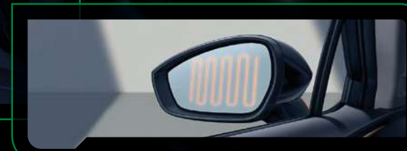
Elektrycznie składane, sterowane i podgrzewane lusterka