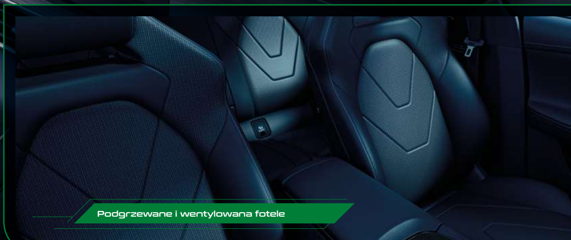
Podgrzewane i wentylowana fotele