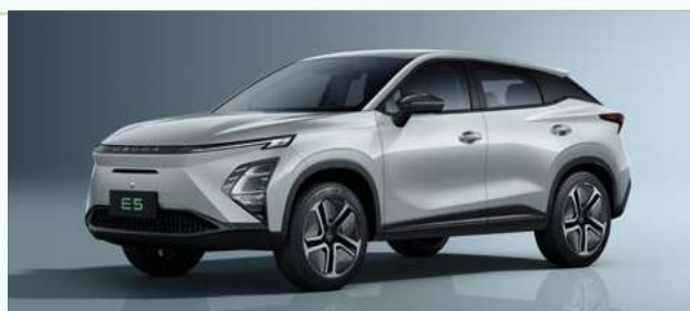
Aviation Silver (KX)