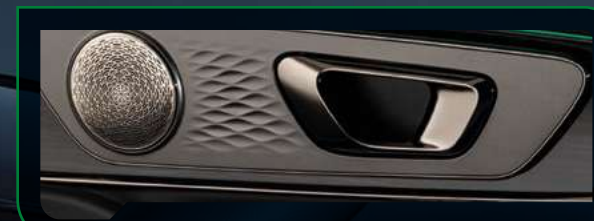
System audio SONY z 8. głośnikami

System obsługi głosowej Hello OMODA, za pomocą którego pasażerowie mogą m. in. otworzyć okna, okno dachowe, ustawić temperaturę układu klimatyzacji. Wyjątkową atmosferę kabiny podkreśli system oświetlenia ambientowego, umożliwiający ustawienie ulubionego koloru podświetlenia wnętrza.