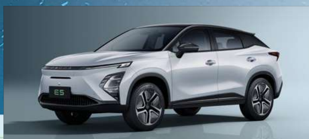
Khaki White z czarnym dachem (ZE)