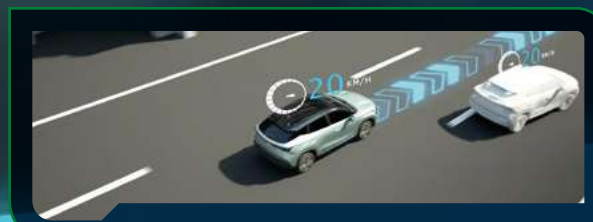
Asystent jazdy w korku