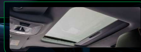
Otwierane okno dachowe