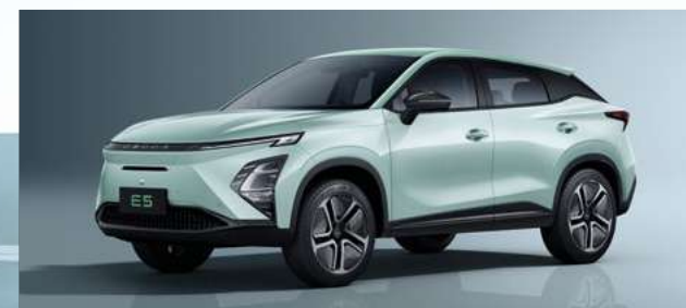
Aqua Green (SK)