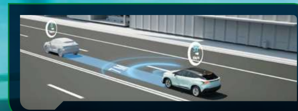
Inteligentny system unikania kolizji (ICS)