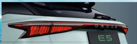
Tylne światła w technologii LED