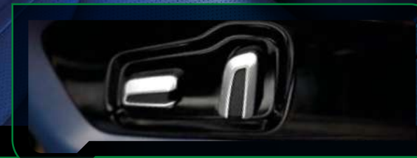
Elektrycznie regulowane fotele