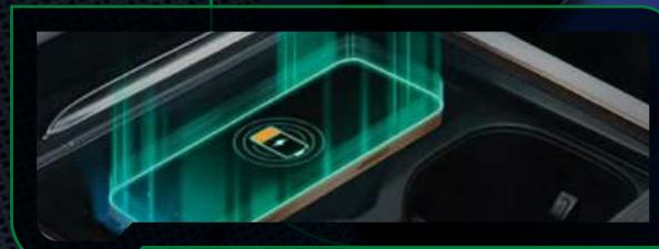
Ładowarka indukcyjna o mocy 50W