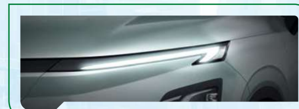
Światła do jazdy dziennej LED

Światła do jazdy dziennej LED w kształcie litery „T” oraz reflektory LED zapewniają lepszą widoczność, a tylne światła z unikalnym efektem 3D podkreślają nowoczesny design pojazdu.