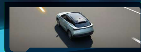
System ostrzegający o niezamierzonej zmianie pasa ruchu (LDW)