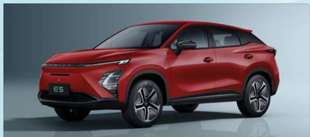
Blood Red (NL)