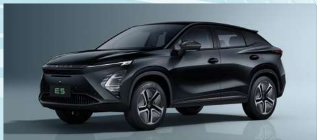
Carbon Black (CL)