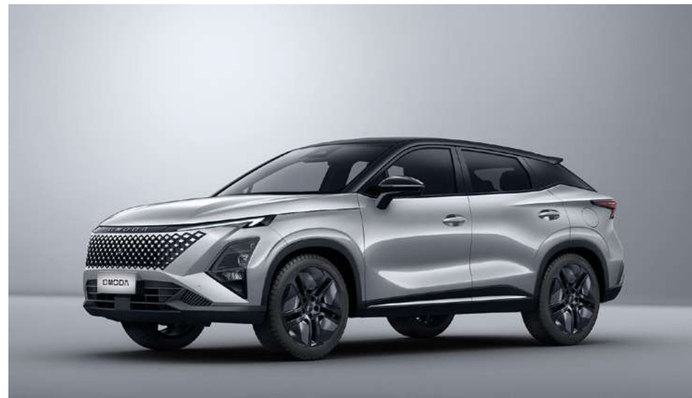
AVIATION SILVER Z CZARNYM DACHEM (X4) Bez dopłaty (tylko wersja Premium)