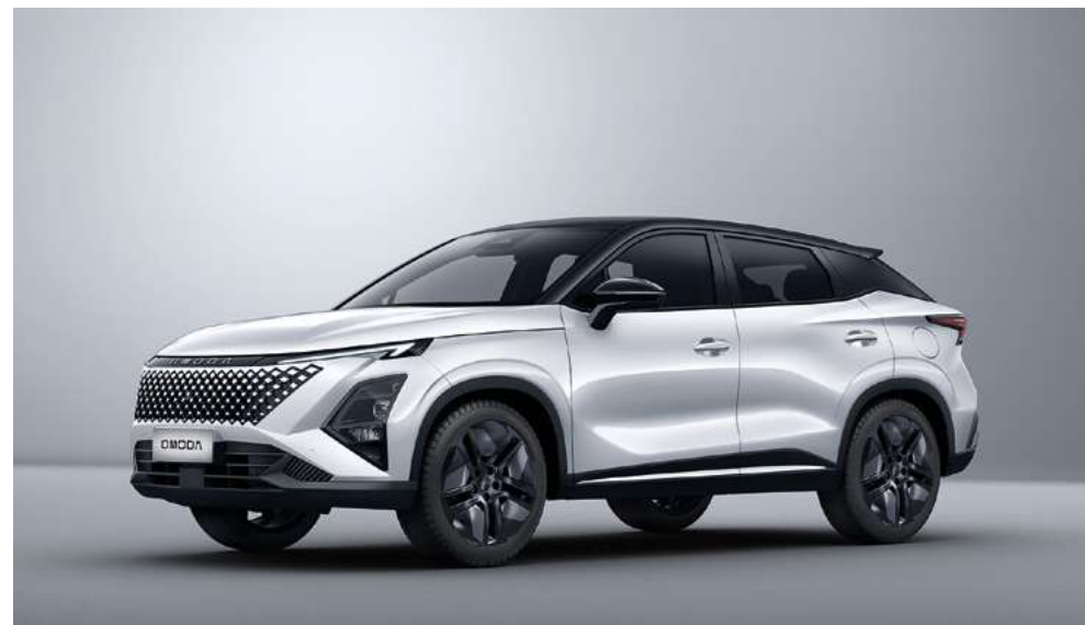
KHAKI WHITE Z CZARNYM DACHEM (ZE) Bez dopłaty (tylko wersja Premium)