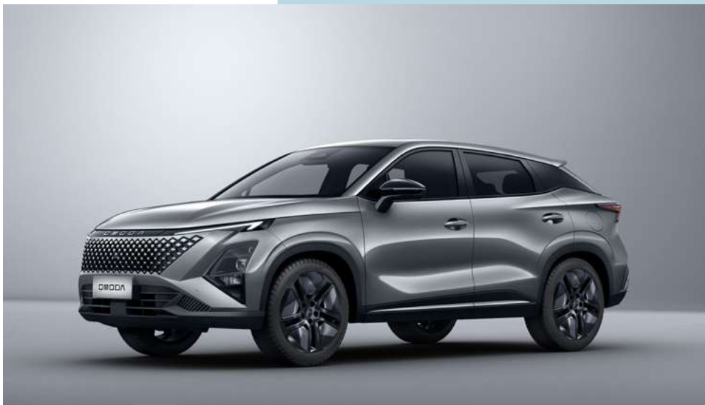
PHANTOM GRAY (GV) - lakier metalizowany Bez dopłaty