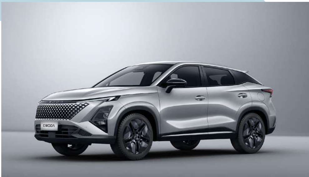
AVIATION SILVER (KX) - lakier metalizowany Bez dopłaty