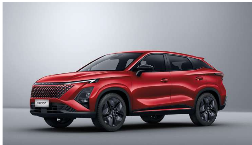
BLOOD RED (NL) - lakier metalizowany Bez dopłaty