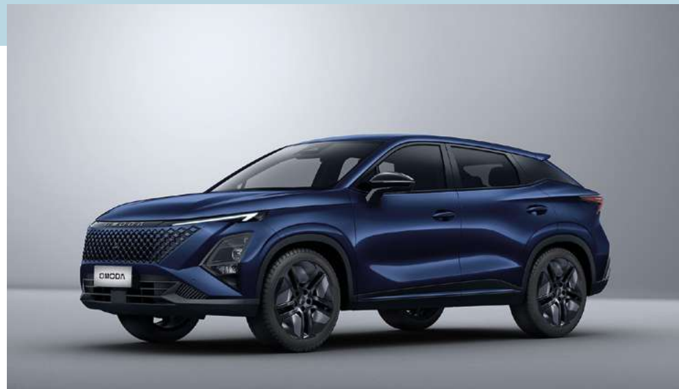
MIDNIGHT BLUE (WB) - lakier metalizowany Bez dopłaty Ostatnie sztuki - dostępne tylko na zapasach magazynowych Dealerów