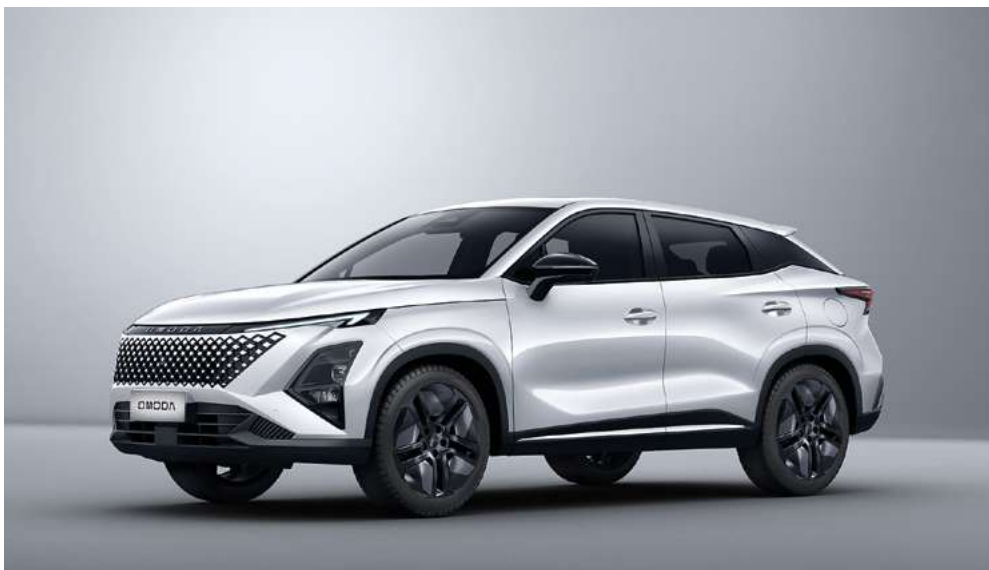
KHAKI WHITE (BW) - lakier metalizowany Bez dopłaty