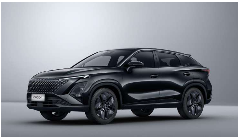
CARBON BLACK (CL) - lakier metalizowany Bez dopłaty